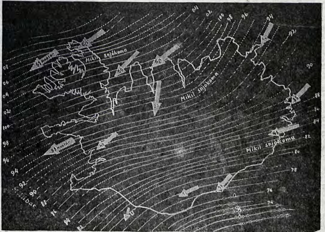
Þannig lítur veðurkort út, sem snir jafnþrýstílinur yfir Íslandi á hádegi 29. janúar, þegar rokið geislaði sem ákafast. Hér er hver milliberalína dregin upp, þegar strikin eru svona þétt sýnir það æðum veðurfræðingi, að ofsarok er á öllu landinu.

En þá gerist það, að menn sjá aðfaranótt 28. janúar, að ný lægð kemur inn á sviðið. Hún kemur af suðlægari slóðum, eða af hafsvæðinu út af Biskayaflóa við Spán og stefnir með miklum hraða beint til norðurs fyrir vestan Írland. Þar sameinast hún hinn eldri kyrrstæðu lægð sem þar var fyrir. Um miðnætti aðfaranótt 28. janúar er miðja þessarar lægðar beint í vestur af Ermasundi. Hún geysist norður á bóginn og um hádegi 28. janúar er miðja hennar vestur af Skotlandi. Um miðnætti aðfaranótt 29. janúar er hún í grennd við Færeyjar. Nú lokins fer að hægja á henni og um hádegi 29. janúar er miðja lægðarinnar rétt út af Hornafirði. Hún er nú orðin mjög djúp, nær svo hátt, að háloftastrumar eru